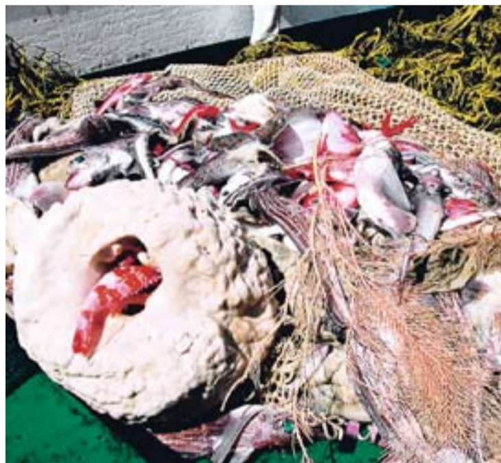
PESCA. Esponjas y plantas arrancadas por una red.